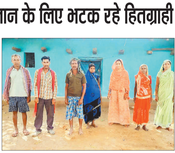
ग्राम पंचायत पोड़ी के हितग्राही।