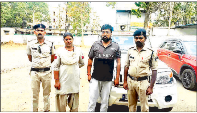
पुलिस गिरफ्तार में आरोपी।