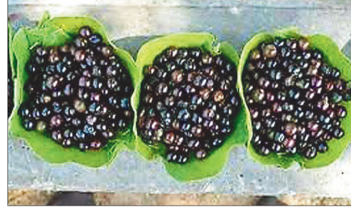
बिक्री के लिए बाजार में आए चार फल।

दोना में चार फल आधा से अधिक रहता है, जिसे 10 रूपए की दर से विक्रय किया जा रहा है। सीजन का फल होने के कारण इसके शौकिन लोग महंगा होने के बावजूद खरीदी कर रहे हैं, क्योंकि शहर के लोगों को जंगल में पाए जाने वाला चार फल बाजार में कभी-कभार मिलता है, ऐसे में ग्रामीणों की संख्या भी कम होती है जो चार फल को जंगल से तोड़कर शहर के बाजार लाते हैं। यही कारण है कि शहर के बाजार में जिन लोगों की नजर चार फल विक्रय होते दिखाई देता है वे जरूर खरीदते हैं। शहर के लिए यह बहुत कम बाजार में मिलने वाला फल है, जबकि ग्रामीण क्षेत्र के लोग जंगलों में आसानी से चार फल प्राप्त कर लेते हैं। इस फल बलरामपुर, सरगुजा क्षेत्रों में पियाय के नाम से भी जाना जाता है, तो कई क्षेत्रों में मकरींदे के नाम से भी जानते हैं।