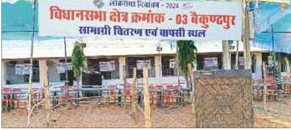
मिनी स्टेडियम से मतदान सामग्री का होगा वितरण।

लोकसभा चुनाव के लिए 7 मई को मतदान होना है, इसके लिए कई दिनों पूर्व से विभिन्न राजनीतिक दलों के द्वारा चुनाव प्रचार-प्रसार किया जाता रहा। तेज धूप व गर्मी के बीच आम सभा व कई कार्यक्रम आयोजित किए जाते रहे। कई दिनों के शोरगुल के बाद 5 मई को अपराह्न चुनावी शोर थम गया। 6 मई को मतदान सामग्रियों का वितरण रामानुज मिनी स्टेडियम से किया जाएगा।